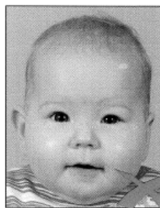
Kopf zu groß