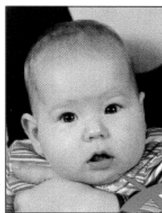
Zweite Person im Hintergrund