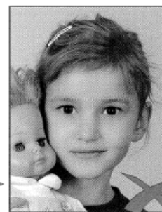
Gegenstand im Bild