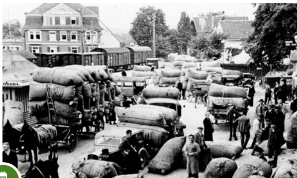
Am Tettnanger Bahnhof um 1930. Verladen der Hopfensäcke

Auf der Wanderung vom Bärenplatz zum Hopfengut N°20 nehmen Tettnanger Hopfenkenner Bürger und Gäste mit auf die Reise in die Welt des Hopfens. Sie sprechen vom Biergenuss in Gasthöfen, Brauereien, einer Hopfenburg, hohen Masten, rechtsdrehenden Pflanzen und dem weltweit geschätzten Tettnanger Aromahopfen. Zur Stärkung servieren die Landfrauen ein zünftiges Hopfengartenvesper. Exquisite Kostproben heimischer Biere gibt's mit Blick auf Alpen und Bodensee.