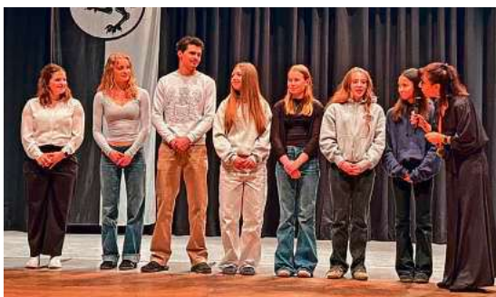
Einen Sieg bei den Baden-Württembergischen Championat holten die Voltigiererin und ein Voltigierer des Reit- und Fahrvereins Krumach 2025 nach Tettang.

Im Nachwuchsbereich zeigten insbesondere die Fechterinnen und Fechter des TSV Tettang starke Leistungen auf Landesebene. Ebenso erfolgreich waren die Voltigiererin und Voltigierer des RFV Krumbach, die als baden-württembergische Champions ausgezeichnet wurden.