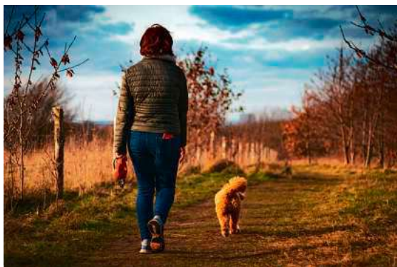
Unterwegs auf dem Feldweg: Rücksicht auf Felder und Wiesen schützt unsere Lebensmittel und die Arbeit der Landwirtschaft.

Hundekot kann Krankheitserreger enthalten, die insbesondere bei der Nutzung von Wiesen als Tierfutter zu gesundheitlichen Problemen bei Nutztieren führen können. Verunreinigtes Gras oder Heu gefährdet die Tiergesundheit und letztlich auch die Qualität der daraus entstehenden Lebensmittel.