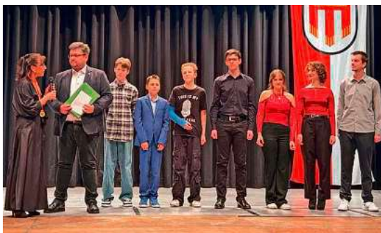
Zahlreiche erste und zweite Plätze belegten 2025 die Fechterinnen und Fechter des TSV Tettang.