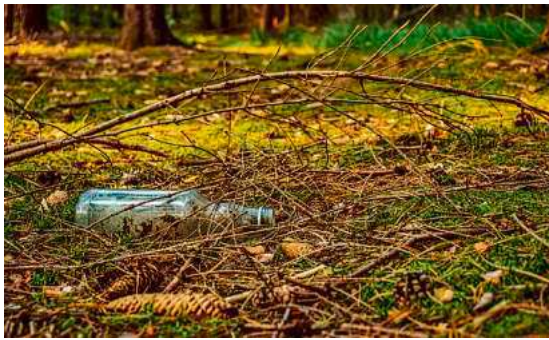
Ein Beispiel für achtlos zurückgelassenen Müll: Abfälle in der Natur stellen eine Gefahr für Tiere, Umwelt und Landwirtschaft dar.

digen oder Tiere verletzen, im schlimmsten Fall verenden sie daran. Kunststoffreste können ins Tierfutter gelangen.