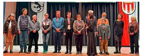
Die Sportlerinnen und Sportler der Pfungstweid räumten 2025 bei den Special Olympics ordentlich ab.

Besondere Anerkennung erhielt zudem die Delegation der Diakonie Pfungstweid, deren Athletinnen und Athleten bei den Special Olympics zahlreiche Medaillen errangen und damit eindrucksvoll für gelebte Inklusion im Sport stehen.