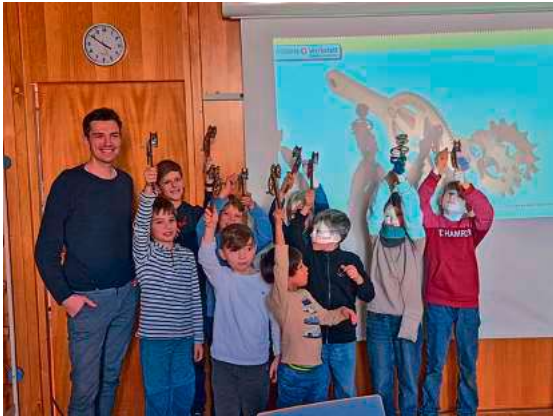
Der MINT-Club in der Stadtbücherei Tettang kommt nicht nur gut bei den Kindern an. Nun ist auch seine hervorragende Qualität offiziell bestätigt.