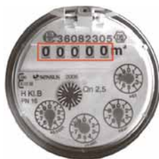
Hier finden Sie den Zählerstand

Ihre Wasserversorgung Unteres Schussental