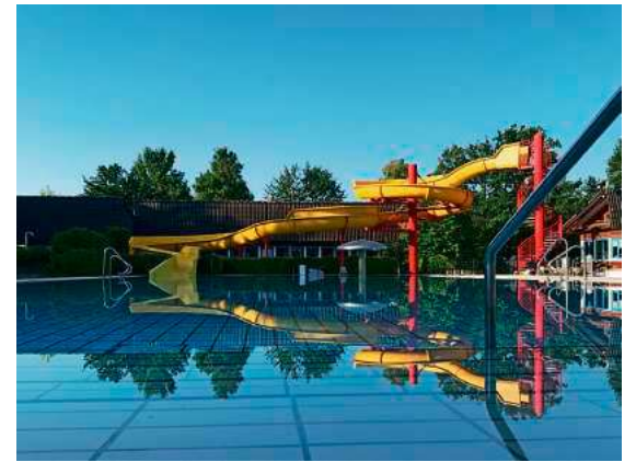
Die Freibäder Ried und Obereisenbach starten am 10. Mai in die Badesaison 2026 – das Bild zeigt das Freibad Ried.

Ein besonderer Dank gilt dem Förderverein zur Erhaltung des Freibades Obereisenbach e. V. Seit seiner Gründung im Jahr 2003 engagiert sich der Verein mit großem Einsatz für das Bad. Auch in diesem Frühjahr halfen die Mitglieder wieder tatkräftig beim Auswintern der Anlage mit.