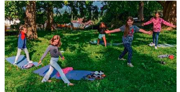
Auch Yoga hat das städtische Sommerferienprogramm wieder im Angebot – kindgerecht und im schönen Grün des Schlossparks.

Neu dabei sind ein Cocktailkurs des Jugendhaus-Teams, ein „Schatzwechsel“, bei dem altes Spielzeug getauscht oder weitergegeben wird, sowie ein Upcycling-Workshop. Aber auch die erfahrungsgemäß schnell ausgebuchten „Evergreens“ wie der Zirkus-Schnupper-Kurs, die Nähkurse der Fadenwerkstatt Betznau oder Voltigiertermine mit dem Reit- und Fahrverein Krumbach sind wieder am Start.