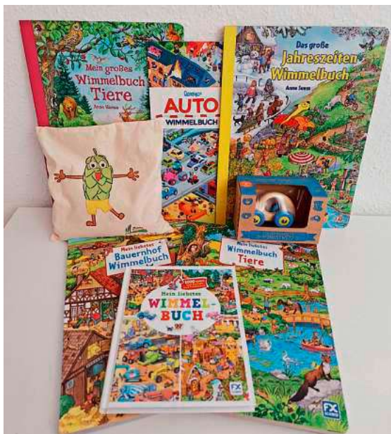
Auf dem Bild sind einige der Begrüßungsgeschenke zu sehen, die Familien im Rahmen der KiWi-Familienbesuche überreicht werden.

In Tettang übernehmen geschulte Familienbesucherinnen diese Aufgabe. Sie besuchen Familien auf Wunsch – in der Regel sechs bis zwölf Wochen nach der Geburt sowie bei Bedarf auch neu zugezogene Familien mit Kindern bis zu drei Jahren.