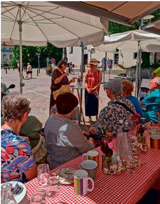
Mit mehr als 100 Besucherinnen und Besuchern wurde das Jubiläum der Anlaufstelle für Bürgerengagement ausgiebig gefeiert.

Die Anlaufstelle für Bürgerengagement der Stadt Tettang feierte am bundesweiten Ehrentag ihr 10-jähriges Jubiläum – und durfte sich an einem wunderbaren Sonntag über großen Andrang freuen. Insgesamt kamen über 100 Besucherinnen und Besucher, sodass am Ende des Tages alle Beteiligten begeistert und auch ein wenig überwältigt waren.