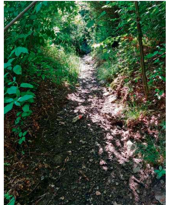
Der Mühlbach ist in Schnetzenhausen bereits trockengefallen.

Seit Freitag, 29. Mai bis vorläufig 29. Juni 2026 gilt per Allgemeinverfügung des Landratsamts ein generelles Verbot der Wasserentnahme aus allen Oberflächengewässern im Bodenseekreis. Das Verbot betrifft sowohl Entnahmen für den Gemeingebrauch als auch für die bereits genehmigte Bewässerung landwirtschaftlicher Flächen.