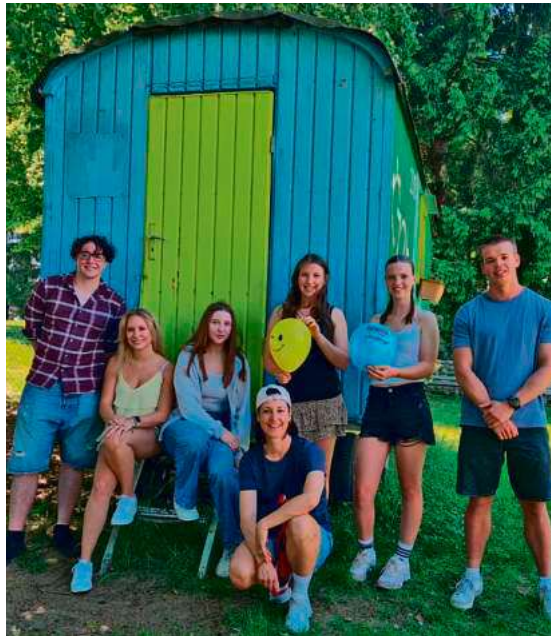
Ferienbetreuung Liebenau Teilhabe