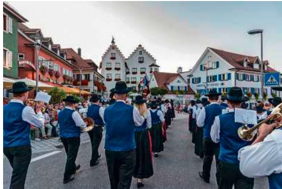
Die Stadtkapelle sorgt am 1. Juli für musikalische Unterhaltung in der Innenstadt.

Berg mit. Ergänzt wird das Programm durch die Jugendblasorchester aus Tettang und Neukirch, das Akkordeonorchester Meckenbeuren sowie das Kreisseniorenorchester des Blasmusikverbandes Bodenseekreis e. V..