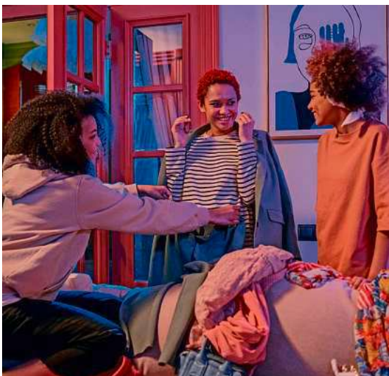
Am 20. Juni heißt es: Stöbern und Lieblingsstücke finden.

Hier haben Besucherinnen und Besucher die Möglichkeit, gut erhaltene Kleidung weiterzugeben und gleichzeitig neue Lieblingsstücke zu entdecken.