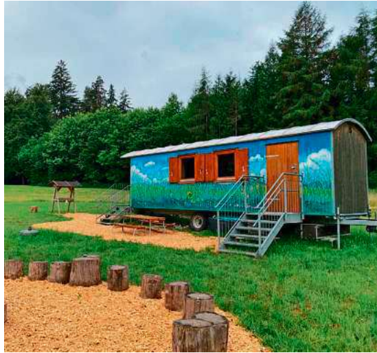
Der bunte Bauwagen des Tettanger Waldkindergartens am neuen Standort im Wald Neuhäusle.

ten sind eingeladen, gemeinsam einen Nachmittag in der Natur zu verbringen.