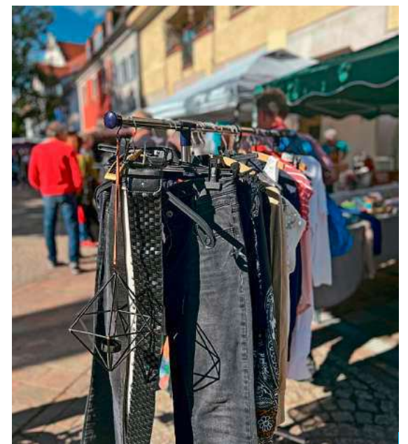
Ob klassischer oder kreativer Krimskrams – der neue Flohmarkt soll vielfältige Stände bieten.

Der Flohmarkt findet am 27. Juni, 25. Juli und 29. August jeweils von 8 bis 13 Uhr parallel zum Städtlesmarkt statt. Geplant sind 15 bis 20 Stände innerhalb der Poller auf dem Montfortplatz. Verkauft werden dürfen gebrauchte Gegenstände sowie selbstgemachte Produkte. Gewerbliche Händler und Neuware sind nicht zugelassen. Organisiert wird das neue Angebot von vier engagierten Frauen mit Unterstützung der Anlaufstelle für Bürgerengagement der Stadt Tettang.