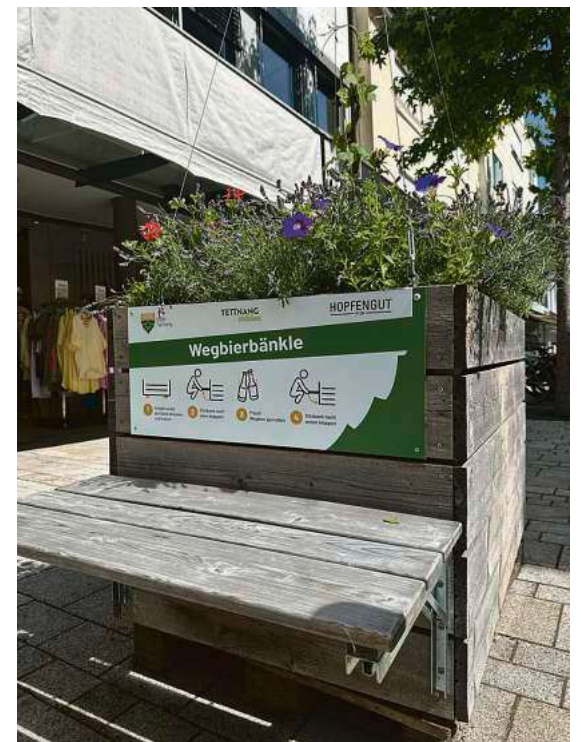
An manchen Hopfenkisten sind „Wegbierbänke“ montiert. Sie laden zum Verweilen und Ausruhen ein.

Gemeinsam mit dem Hopfengut No20 und dem Citymarketingverein Tettang erleben e. V. bringt das Stadtmarketing Tettang das „grüne Gold“ auch in diesem Jahr wieder genau dorthin, wo das Herz unserer Stadt schlägt: direkt in die wunderschöne Innenstadt Tettangs. An ausgewählten Standorten und mit noch mehr Hopfenkisten als in den vergangenen Jahren können Passanten im Vorbeigehen hautnah miterleben, wie Tettang seinem Titel als stolze Hopfenstadt alle Ehre macht. Das Besondere daran: Die Hopfenkisten werden in Patenschaft von engagierten Innenstadthändlern direkt vor ihren Geschäften gepflegt und gehegt. Ein echtes Gemeinschaftsprojekt, bei dem der Hopfen mit viel Liebe und lokalem Teamgeist bewässert wird.