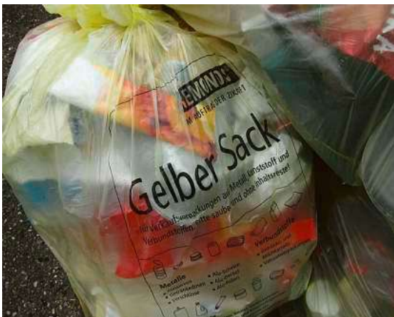
Stehen die Gelben Säcke längere Zeit im Freien werden sie häufig vom Wind verweht oder von Tieren aufgerissen.

Hinzu kommt: Stehen die Säcke über längere Zeit im Freien, werden sie häufiger vom Wind verweht oder durch Regen und Tiere beschädigt. Der Inhalt verteilt sich dann auf Straßen, Grünflächen und in der Natur. Die Folge sind zusätzliche Verschmutzungen und ein höherer Reinigungsaufwand. Zudem locken die Säcke, in denen sich häufig noch Essensreste befinden, Ratten, Krähen und Ungeziefer an.