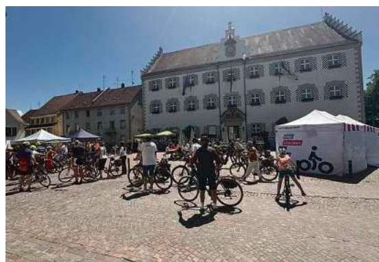
Teilnehmende der Sternfahrt trafen auf dem Montfortplatz in Tettang ein und sorgten zum Auftakt des STADTRADELN für eine lebendige Atmosphäre in der Innenstadt.

Bei bestem Radfahrwetter führte die Sternfahrt am vergangenen Samstag zahlreiche Radlerinnen und Radler aus dem Bodenseekreis und dem Landkreis Lindau nach Tettang. Ziel der drei geführten Routen war der Montfortplatz in Tettang, wo die Teilnehmenden im Rahmen der Auftaktveranstaltung zum STADTRADELN herzlich empfangen wurden. Insgesamt kamen rund 150 Menschen zusammen und sorgten für eine lebendige und fröhliche Atmosphäre in der Innenstadt.