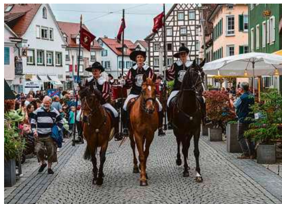
Höhepunkt des Festes ist der historische Umzug am Sonntagvormittag.

Höhepunkt des Festwochenendes ist der historische Festumzug am Sonntag, 5. Juli, ab 11 Uhr. Kindergärten und Schulen in rund 50 Fußgruppen, 35 Reitergruppen und Festwagen sowie zehn Musikkapellen und Fanfarenzüge bringen die Geschichte der Grafen von Montfort und der Hopfenstadt Tettang auf die Straßen der Innenstadt.