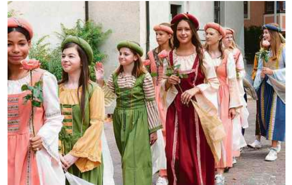
Beim Festumzug sind in diesem Jahr die Tettninger Kindergärten und Schulen in 50 Fußgruppen in historischen Gewändern dabei.

Das vollständige Programm des Montfortfestes 2026 ist unter www.tettang.de/montfortfest erhältlich.