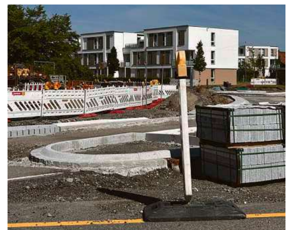
Der Baufortschritt am künftigen Kreisverkehr Schäferhof–Oberhof wird zunehmend sichtbar.

Die Arbeiten am neuen Kreisverkehr Schäferhof–Oberhof kommen planmäßig voran. Der Baufortschritt ist inzwischen deutlich sichtbar. Seit dem Start des ersten Bauabschnitts Mitte April werden der westliche Teil des Kreisverkehrs, der Mittelring, der Radweg sowie die angrenzenden Grünflächen hergestellt. Zusätzlich entstehen mehrere Versickerungsmulden zur Regenwasserbewirtschaftung, die insbesondere bei Starkregen zur Entlastung der Entwässerung beitragen sollen. Dieser Tage soll mit dem Einbau der ersten Asphaltsschicht begonnen werden. Bis Ende Juni sollen die Arbeiten des ersten Bauabschnitts abgeschlossen sein.