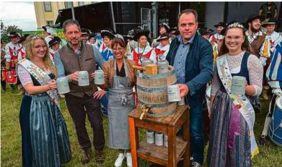
Am Freitagabend wird Bürgermeisterin Regine Rist wieder traditionell zur Eröffnung des Montfortfestes ein Bierfass anstechen.

Den Auftakt bildet am Freitag, 3. Juli, um 18.30 Uhr, die traditionelle Eröffnung mit Fassanstich auf der Festwiese im Schlosspark und dem Sternmarsch der drei Fanfarenzüge. Anschließend sorgen die Musikkapelle Obereisenbach und die Stadtkapelle Tettang für Stimmung.