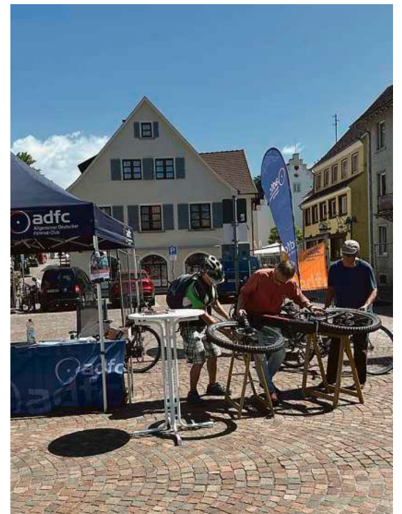
Im Rahmen der Auftaktveranstaltung bot der ADFC eine Fahrradcodierung an. Die Kennzeichnung hilft dabei, Fahrräder besser vor Diebstahl zu schützen.

klimafreundlich mit dem Fahrrad zurückzulegen und gemeinsam Kilometer für Tettang zu sammeln.