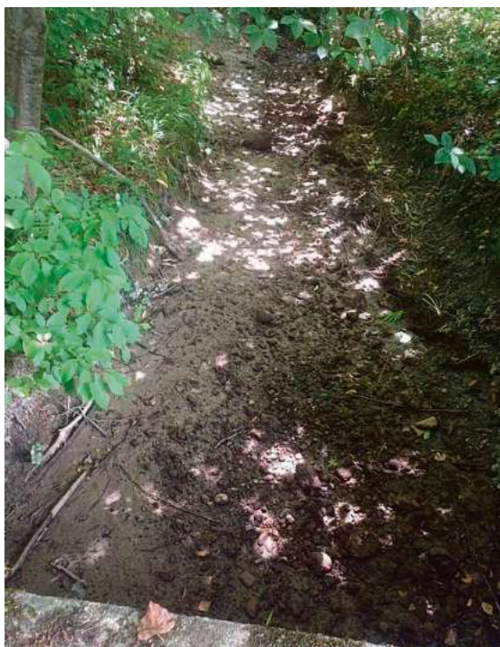
Der Mühlkanal der Brunnisach führte am 25. Juni 2026 kein Tröpfchen Wasser.

Das seit Ende Mai geltende Wasserentnahmeverbot für Oberflächengewässer wird im Bodenseekreis bis vorerst 31. August 2026 verlängert. Weiterhin verboten ist damit das Abpumpen aus Fließgewässern wie Bächen, Flüssen und Triebwerkskanälen sowie aus Weihern und Seen für den Gemeindegebrauch sowie zur Bewässerung landwirtschaftlicher Flächen.