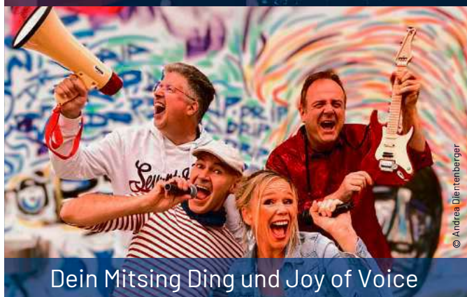
Dein Mitsing Ding und Joy of Voice