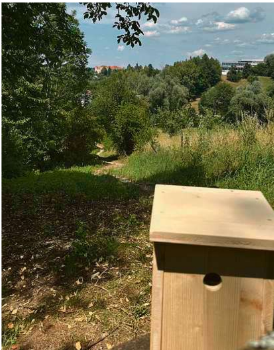
Gut versteckt: Dieser Nistkasten ist Teil der NaTTur-Rallye und wartet darauf, entdeckt zu werden.

In Tettang und den Ortschaften gibt es in den kommenden Wochen besondere Schätze zu entdecken: Im Rahmen der „NaTTur-Rallye“ versteckt die Stadt Tettang regelmäßig Insektenhotels und Nistkästen an wechselnden Orten im Stadtgebiet sowie in den Ortschaften.