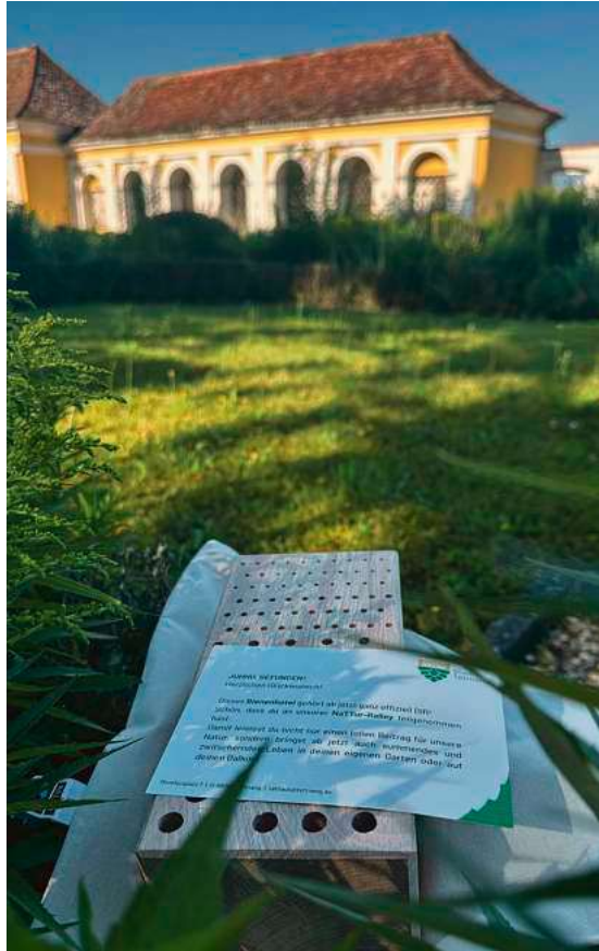
Auf die Suche gehen lohnt sich: Dieses Insektenhotel ist an einem geheimen Ort in Tettang versteckt.

Wer den Hinweis erkennt, den Standort findet und als Erste oder Erster vor Ort ist, darf das jeweilige Insektenhotel oder den Nistkasten mit nach Hause nehmen und dort aufstellen. Hinweise zu den Verstecken veröffentlicht die Stadt Tettang über ihre Social-Media-Kanäle, beispielsweise in Form eines Bildausschnitts des jeweiligen Standorts. Um möglichst vielen Interessierten die Teilnahme zu ermöglichen, werden die Zeitpunkte der Versteckaktionen wöchentlich variiert.