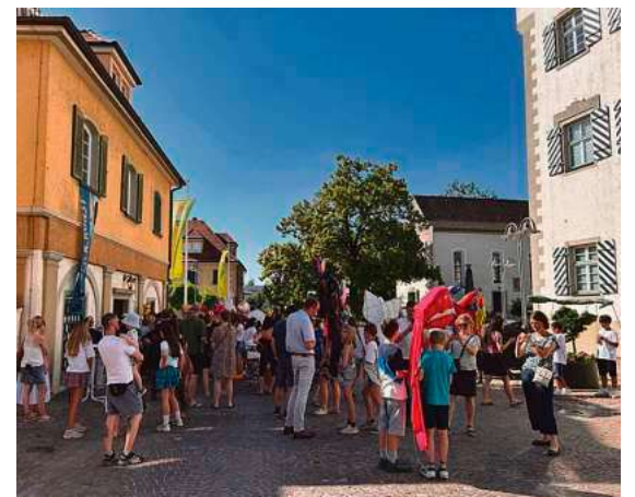
Die Kunstwerke der Schülerinnen und Schüler des Montfort-Gymnasiums fanden bei der Vernissage am Donnerstag, 25. Juni, sehr großen Anklang.

Das Programm startete bereits mit Arbeiten der Kunst-Vorprofilklassen des Montfort-Gymnasiums: Überlebensgroße Stabfiguren, ausdrucksstarke Porträts, farbig gestaltete Tierkörper und vieles mehr sind unter dem Motto „EIN.BLICK.KUNST“ noch bis zum 5. Juli zu sehen. Die Schülerinnen und Schüler der Stufen 5 bis 7 zeigen eindrucksvoll, wie aus Ideen lebendige Kunst wird.