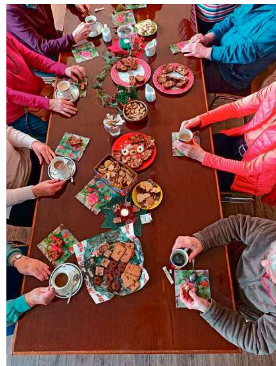
Geselliges Miteinander gab es in der Advents- und Weihnachtszeit in ganz Tettang, hier der Kaffeenachmittag in der Anlaufstelle für Bürgerengagement zwischen Weihnachten und Silvester.

Insgesamt 66 Menschen nahmen an der Veranstaltungsreihe „Advent & Weihnachten gemeinsam“ teil und verbrachten die Advents- und Weihnachtszeit in geselliger Gemeinschaft. Die Initiative der Stadt Tettang, der katholischen und evangelischen Kirchengemeinden sowie des Familientreffs Tettang bot an verschiedenen Orten offene Begegnungsmöglichkeiten für alle Interessierten.