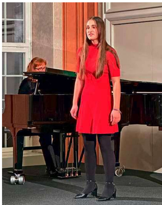
Musikalischer Beitrag mit Gesang und Klavier beim Neujahrsempfang der Stadt Tettang.

Musikalisch begleitet wurde der Neujahrsempfang von der städtischen Musikschule. Ein Bläserquintett eröffnete den Abend, weitere Gesangs- und Klavierbeiträge setzten stimmungsvolle Akzente und rundeten das Programm ab. Für einen unterhaltenden Höhepunkt sorgte Mentalmagier Andy Häussler, der das Publikum mit verblüffenden Effekten zum Staunen brachte.