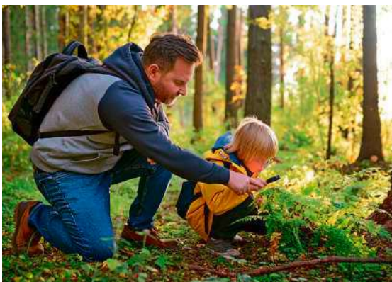
Ein Nachmittag voller Erlebnisse erwartet Väter und ihre Kinder ab vier Jahren am Samstag, 31. Januar 2026.

Ein Nachmittag voller Erlebnisse erwartet Väter und ihre Kinder ab vier Jahren am Samstag, 31. Januar 2026. Ab 14:00 Uhr lädt der Familientreff Kunkelhaus in Überlingen zu einer kostenlosen Abenteuertour in der Natur ein. Auf einem Streifzug durch den Wald wird das Unterholz nach besonderen Dingen erkundet, es werden Erinnerungsstücke aus Naturmaterialien gebaut, geschnitzt, gespielt und getobt sowie Feuer gemacht. Zum Abschluss wird gemeinsam gegrillt. Treffpunkt ist der kleine Parkplatz hinter der HEM-Tankstelle in Überlingen: https://maps.app.goo.gl/Et1BfLzuaSGfeNq7