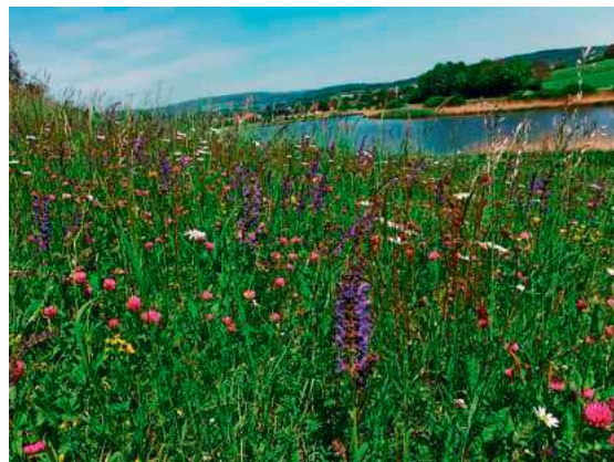
Artenreiches Grünland weist ein buntes Angebot an Blütenfarben auf mit weißen, gelben, roten und violetten Blumen.

Blumenreiches Grünland erfreut nicht nur das Auge und die Insektenwelt, sondern ist auch in der besonders artenreichen und hochwertigen Form als „Magere Flachlandmähwiese“ geschützt. Magere Flachlandmähwiesen zeichnen sich durch besonders artenreiches, blumenbuntes Grünland aus und sind oftmals durch jahrzehntelange extensive Bewirtschaftung mit zweischüriger Heumahd und mäßiger Düngung entstanden. Als geschütztes Biotop und geschützter FFH-Lebensraumtyp dürfen sie sich aufgrund ihres Schutzstatus nicht in ihrer Qualität verschlechtern, es gilt somit ein Erhaltungsgebot bzw. Verschlechterungsverbot. Seit der Offenlandbiotopkartierung 2022 und 2023 sind die Mageren Flachlandmähwiesen im Bodenseekreis sowohl innerhalb als auch außerhalb der Fauna-Flora-Habitat-Gebiete (FFH-Gebiete) nun flächendeckend kartiert und geschützt. Die Lage der Mageren Flachlandmähwiesen ist in den landwirtschaftlichen Kartensystemen (FIONA) sowie im öffentlichen Kartenservice der Landesanstalt für Umwelt Baden-Württemberg (LUBW) (UDO: https://udo.lubw.baden-wuerttemberg.de ) einsehbar.