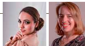
© Anjolie Hartrampf + Iris Wallner

Vorverkauf: 28 €, ermäßigt 14 €, Abendkasse: 30 €, erm. 15 €