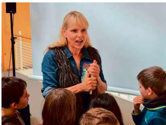
Kinderbuchautorin Barbara Rose beantwortet Fragen nach der Lesung.

An der spannendsten Stelle stoppte sie – sehr zur Freude der jungen Zuhörerinnen und Zuhörer, die nun unbedingt im Buch weiterlesen wollten.