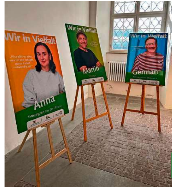
Am 26. Oktober war die Ausstellung einen Tag lang im Neuen Schloss zu sehen.

Erstmals gezeigt wurden die großformatigen Porträts am 26. Oktober in der Säulenhalle des Neuen Schlosses im Rahmen des Internationalen Suppenfests . Ab 13. November bis Ende Januar 2026 ist die Ausstellung im Rathaus Tettang zu sehen.