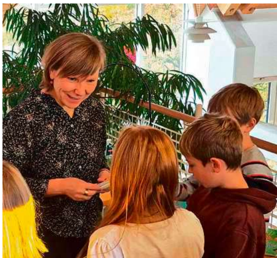
Viele Fragen an Kinderbuchautorin Franziska Gehm nach der Lesung.

Die humorvolle, altersgerechte Geschichte vermittelte auf spielerische Weise erstes Wissen über Künstliche Intelligenz – und zeigte zugleich ihre Grenzen auf, etwa bei der Frage: „Welche Farbe hat mein Pullover?“.