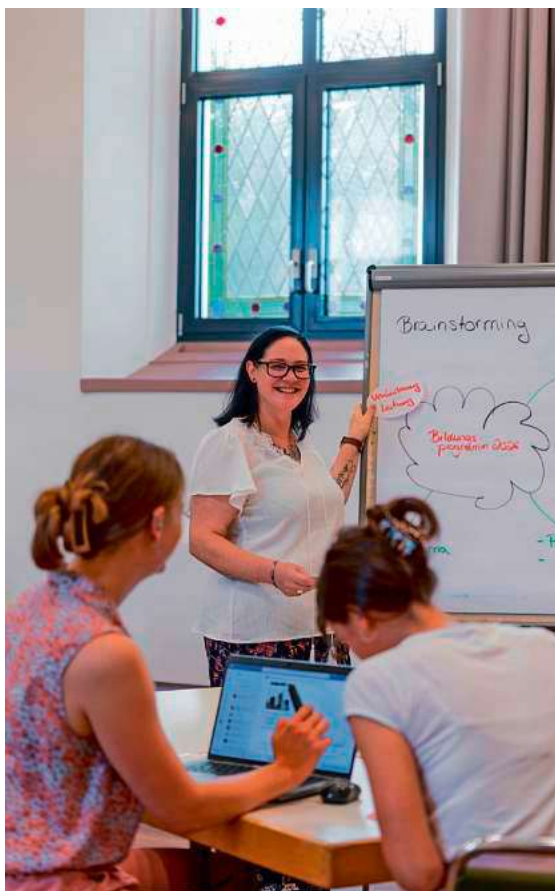
Das neue Bildungsprogramm der Akademie Schloss Liebenau für das Jahr 2026 bietet eine große Vielfalt an Fort- und Weiterbildungen.

Weitere Informationen zu den Kursen sowie zur Anmeldung gibt es unter Telefon 07542/10-1266 oder per E-Mail akademie@stiftung-liebenau.de .