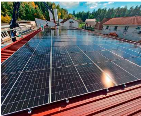
Die PV-Anlage auf dem Carport des Bauhofs ist bereits montiert.

Bereits abgeschlossen sind die Dachmontagen auf dem Carport des Bauhofs und der Aussegnungshalle auf dem neuen Friedhof sowie an den Asylgebäuden Manzenberg 4 und 4/1 laufen die Arbeiten derzeit. In den Herbstferien wurden zudem die Anlagen auf der Mensa Manzenberg und der Realschule Tettang begonnen – letztere ist mit ihrer Leistung von 189,9 kWp (Kilowattpeak) die größte PV-Anlage, die die Stadt in diesem Jahr realisiert. Noch ausstehend ist die Installation auf dem Kinderhaus im Haus Josefine Kramer, die in den kommenden Wochen erfolgt. Nach abgeschlossener Montage starten bei allen Anlagen die Elektroarbeiten.