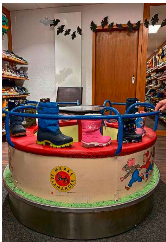
Im Winter 2024/25 wurden im Rahmen der Winterschuhaktion 100 Gutscheine eingelöst.

Dank großzügiger Spenden geht die Aktion 2025 bereits ins vierte Jahr. Seit Beginn der Aktion ist der Spenderkreis gewachsen. Neben Lions Club, Integrationsnetzwerk und der Stadt Tettang beteiligen sich die Soroptimisten Bodensee, die Praxis für Kieferorthopädie Dr. Mareike von der Heide und die Zahnarztpraxis Dr. Herz & Böhringer.