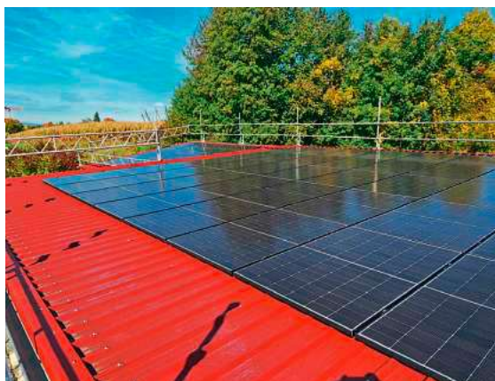
Mit den neuen sechs Anlagen betreibt die Stadt nun 19 PV-Anlagen (inkl. Sporthalle Manzenberg und Kita Krumbach)

Die Stadt Tettang treibt ihre Photovoltaik-Strategie weiter konsequent voran: Nach der erfolgreichen ersten Etappe im vergangenen Jahr werden derzeit sechs weitere städtische Gebäude mit Solaranlagen ausgestattet. Insgesamt investiert die Stadt 567.800 Euro in die neuen Anlagen, die im kommenden Frühjahr ans Netz gehen sollen.