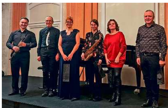
Für die neue Musikschulstiftung spielten Lehrkräfte der Städtischen Musikschule im Rittersaal des Neuen Schlosses ein Benefizkonzert.

Die Stiftungsgründung wurde selbstverständlich gebührend musikalisch gefeiert. Gegen 17 Uhr luden Lehrkräfte der städtischen Musikschule zu einem Benefizkonzert zugunsten der neuen Musikschulstiftung in den Rittersaal des Neuen Schlosses ein. Gespielt wurden unter anderem Werke von Johann Sebastian Bach, Wolfgang Amadeus Mozart, Franz Schubert, George Gershwin.