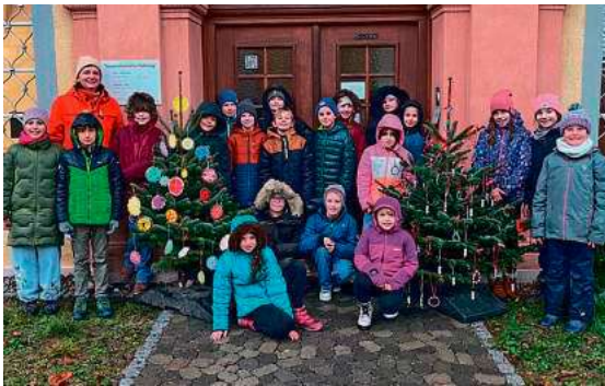
Die Klasse 4a der Grundschule Kau schmückte die beiden Weihnachtsbäume vor der Tourist Information mit selbst gebasteltem Christbaumschmuck.

Unterstützt wurden sie bereits bei der Vorbereitung von den Schülerinnen und Schülern der Klasse 3a, die an zwei Bastelnachmittagen in Kau viele verschiedene, bunte Anhänger gestalteten.