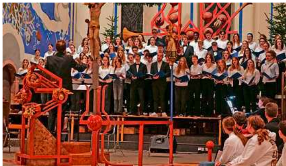
Großer Chor 2024

Am Donnerstag, den 18. Dezember 2025, lädt das Montfort-Gymnasium um 19 Uhr zu seinem traditionellen Weihnachtskonzert in die St.-Gallus-Kirche ein. Den musikalischen Auftakt gestalten die Schülerinnen und Schüler der 5. Klassen mit Advents- und Weihnachtsliedern. Danach präsentiert der Jugendchor der Klassen 6 und 7 schwungvolle, aktuelle Werke aus Frankreich und den USA. Der Eltern-Lehrer-Chor bringt weihnachtliche Kompositionen aus verschiedenen Epochen zu Gehör.