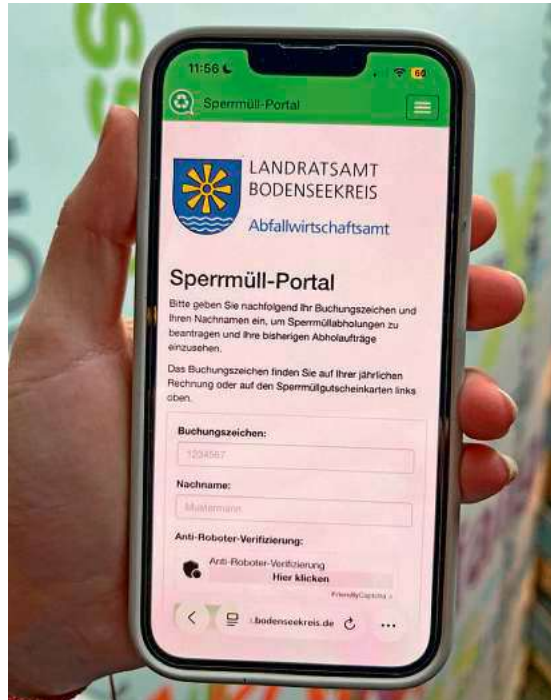
Die Sperrmüllanmeldung ist künftig ausschließlich digital möglich.

Wer keinen Internetzugang hat oder Unterstützung bei der Nutzung der neuen digitalen Services braucht, kann sich direkt an das Abfallwirtschaftsamt wenden: sperrmuell@bodenseekreis.de oder Tel. 07541 204-5199.