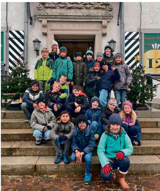
Die Klasse 4c der Schillerschule gestaltete den Christbaumschmuck für die beiden Weihnachtsbäume vor dem Rathaus.