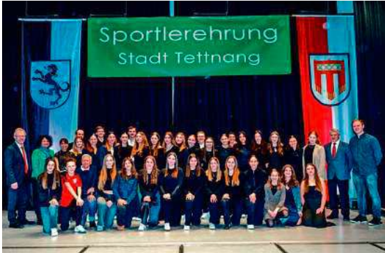
Die ausgezeichneten Sportlerinnen und Sportler des Jahres 2025.

Nach dem großen Erfolg der Sportlerehrung am 24. Januar 2025 – bei der acht Sportlerinnen und Sportler, zwei Mannschaften, zwei langjährige Vorstandsmitglieder sowie das Handball-Schiedsrichter-Duo Merz/Kuttler geehrt wurden – möchte die Stadt Tett nang auch 2026 erneut besondere sportliche Leistungen und herausragendes Engagement im Bereich des Sports würdigen.