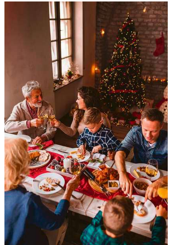
Viele gesellige Runden gibt es in diesem Jahr in der Advents- und Weihnachtszeit in Tettang, damit das Miteinander ganz unkompliziert wird.

nachten gemeinsam“ nachgemeldet werden (Tel. 07542 510-107 oder melanie.friedrich@tettang.de ).