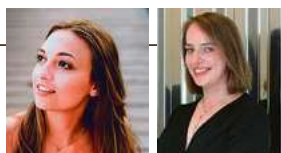
© Anjulie Hartrampf + Iris Wallner

Sonntag, 22. März 2026, 17 Uhr St. Gallus Kirche Tettang