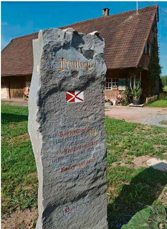
Die Stele, die Rappertsweiler als „Ort der deutschen Demokratiegeschichte“ kennzeichnet.

Im Rahmen des 500-jährigen Gedenkens an den Bauernkrieg, den Rappertsweiler Haufen und dessen Einsatz für Freiheit und Gerechtigkeit wurde der Ortschaft am 1. Juni 2025 von der Stiftung „Orte der deutschen Demokratiegeschichte“ das Prädikat „Ort der deutschen Demokratiegeschichte“ verliehen.