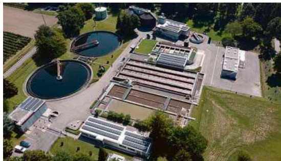
Kläranlage Eriskirch

„21 unserer 23 Kreisgemeinden sind an dem Umweltprojekt beteiligt und übernehmen Verantwortung für das Ökosystem und die Trinkwassersicherung für Millionen Menschen im Versorgungsgebiet des Bodensees“, betont Landrat Luca Wilhelm Prayon.