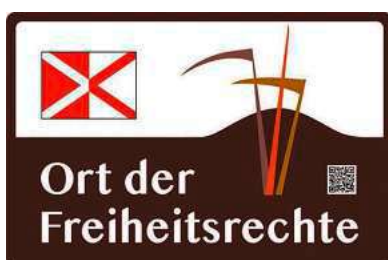
Das neue Schild, das Rappertsweiler als „Ort der Freiheitsrechte“ ausweist

Das von Ulrike Böhner gestaltete und äußerst gelungene Schild zeigt den Blasenberg als historischen Versammlungsort des Jahres 1525 sowie die typische Bewaffnung der Bauern. Ergänzt wird es durch das Feldzeichen der Bauern und einen QR-Code, der direkt auf die Webseite der Stiftung „Orte der deutschen Demokratiegeschichte“ führt.