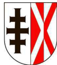
Das neue Wappen der Ortschaft Langnau

Im Zuge der historischen Aufarbeitung der Ereignisse von 1525 rund um den Bauernkrieg im Argental und den Rappertsweiler Haufen entstand der Wunsch, das bislang nachweislich falsche Wappen der Ortschaft Langnau zu überarbeiten und stärker an die tatsächliche Ortsgeschichte anzulehnen. Der regional bekannte Heraldiker Gisbert Hoffmann entwickelte hierzu drei Alternativentwürfe. Der Ortschaftsrat Langnau entschied sich am 2. Dezember 2025 für den Vorschlag, der das Dreifachkreuz des Paulinerordens – als Verweis auf das Kloster Langnau – sowie das Andreaskreuz als Symbol des Bauernkriegs und Feldzeichen des Rappertsweiler Haufens aufgreift.