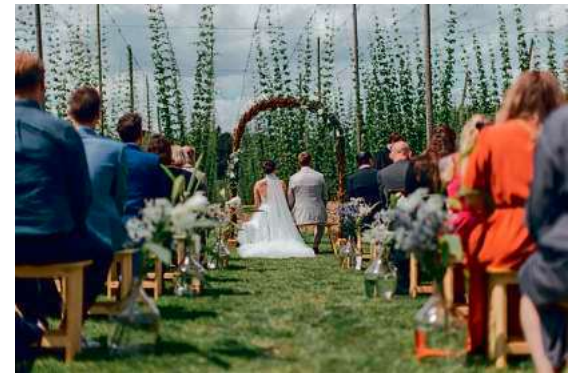
Idyllisch im Grünen oder im Brauereiraum können Paare jetzt im Hopfengut №20 standesamtlich heiraten.

das Hopfenmuseum ein besonderes Alleinstellungsmerkmal besitzt und zugleich einen repräsentativen Bezug zur Stadt aufweist. Damit standesamtliche Trauungen dort angeboten werden können – vergleichbar mit dem Neuen Schloss, in dem seit rund 15 Jahren Eheschließungen stattfinden.