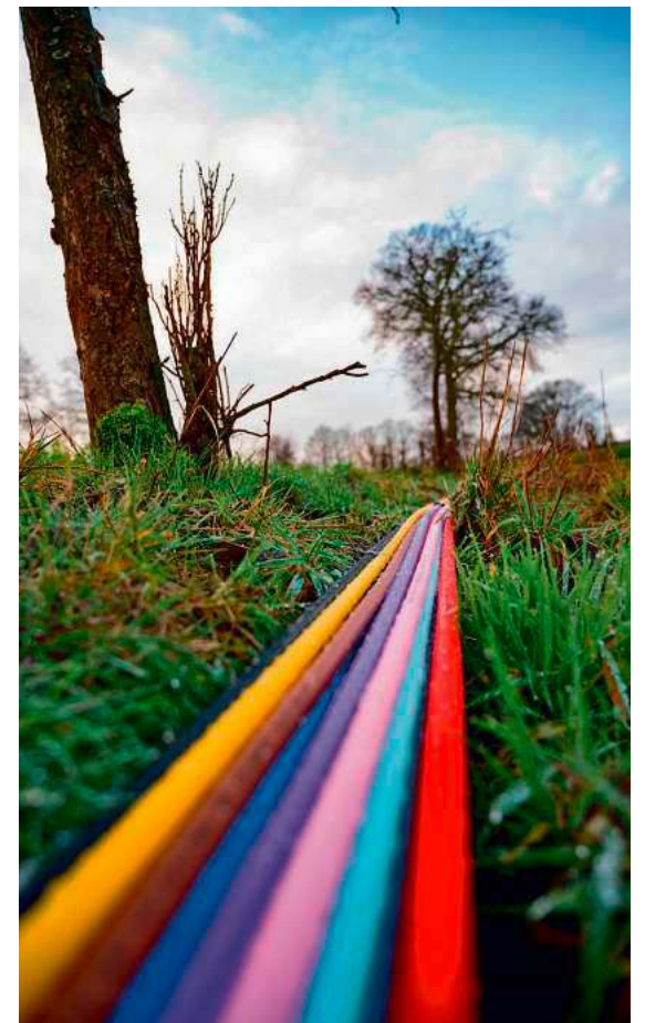
Schnelles Internet kommt nun auch in das Tettanger Hinterland.

Die Stadt hatte sich Mitte September 2025 bereits zum dritten Mal um eine Aufnahme in das Förderprogramm beworben. Mit den nun zugesagten Mitteln können die noch verbliebenen Adressen erschlossen werden, die bislang über eine unzureichende Internetversorgung verfügen. Dabei handelt es sich um sogenannte „dunkelgraue Flecken“ – Gebiete, in denen derzeit keine gigabitfähige Versorgung besteht und für die kein eigenwirtschaftlicher Ausbau durch private Anbieter geplant ist.