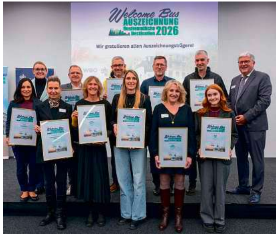
Alle prämierten Destinationen und Partner bei der Verleihung auf der CMT Stuttgart.

Ein weiterer Pluspunkt sind die kostenlosen, zentrumsnahen Busparkplätze sowie der Fokus auf Barrierefreiheit – etwa durch eine barrierefreie Toilette am Busparkplatz und barrierefreie Schlossführungen. Auch das Engagement der Stadt in den Bereichen Klimaschutz sowie nachhaltiges Wirtschaften und Leben wurde positiv hervorgehoben.