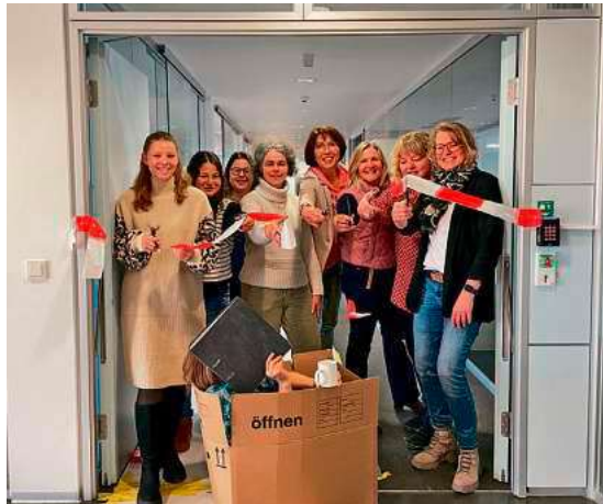
Start im neuen Haus: Mit dem symbolischen Banddurchschnitt zieht das Amt für Bildung als erstes Amt ins neue Gebäude ein.

Für Bürgerinnen und Bürger bleibt vieles unverändert: Mailadressen und Telefonnummern gelten weiterhin, Termine finden wie gewohnt nach vorheriger Vereinbarung statt. Da der Zugang zum Gebäude nicht frei zugänglich ist, befindet sich am Eingang eine Klingel. Besucherinnen und Besucher werden nach dem Klingeln eingelassen.