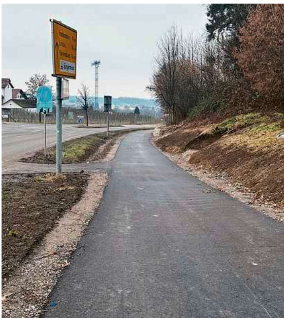
Der Radweg an der Seestraße (L333) ist zwischen Schloßstraße und Tobelstraße wieder freigegeben; die Markierungsarbeiten stehen noch aus.

Die Bauarbeiten am Radweg sind soweit abgeschlossen, dass Radfahrerinnen und Radfahrer den Abschnitt bis zur Tobelstraße sicher befahren können. Aufgrund der derzeitigen Witterung lässt sich die Markierung der Fahrbahn noch nicht aufbringen. Die Linien auf der Strecke werden aufgebracht, sobald die Wetterbedingungen eine qualitativ hochwertige Ausführung zulassen. Parallel dazu wird die Markierung entstehen, wenn der Radweg bis zur Unterführung fertiggestellt ist. Voraussichtlich wird das im 2. Quartal 2026 sein.